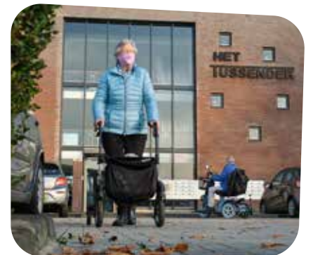
Bewoners van Het Tussendek nemen het zekere voor het onzekere.

boodschappen bestellen. Daar hoeft ik de deur niet voor uit. Ik zie dus gelukkig nog wel genoeg mensen. En daarnaast bel en app ik veel met mijn familie. Ik ben zo blij dat ik dat kan. En verder is het maar hopen dat corona wegblijft. Maar als het komt, dan komt het. Erop mopperen helpt niet, zei mijn vader altijd. Daar verdwijnt het niet mee. En zo is het."