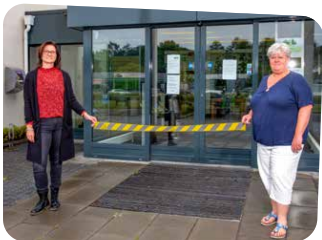
Medewerkers van OFW brengen de anderhalve meter afstand in beeld.