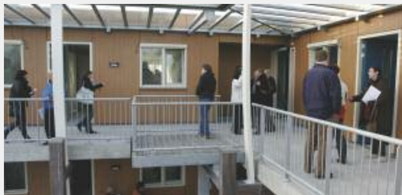
Op de galerij konden de bezoekers enkele woningen bekijken van de woonservicezone de Ark.

De toekomstige huurders waren vanaf het begin al erg nieuwsgierig naar hun nieuwe woning. Hoe zal het er van binnen uit zien? Wat is de indeling? Natuurlijk konden zij dit al op de plattegronden zien,