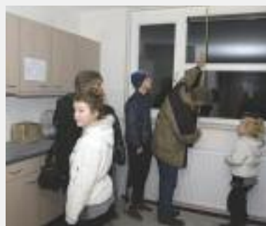
Bezoekers van de open dag in de Korendragersgilde namen alvast de maten, zodat ze hun woning goed konden inrichten.

maar in het echt is dat toch anders. Sommigen kwamen met een rolmaat om alles op te meten, bijvoorbeeld voor de lengte van de gordijnen. Zij verlieten enthousiast hun