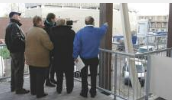
Ook het uitzicht vanaf de woonservicezone werd bewonderd.

maar in het echt is dat toch anders. Sommigen kwamen met een rolmaat om alles op te meten, bijvoorbeeld voor de lengte van de gordijnen. Zij verlieten enthousiast hun