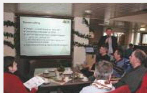
De woonservicezone wordt op duurzame wijze verwarmd door de warmte-koudeopslag. Hierdoor is er koeling beschikbaar. De toekomstige bewoners krijgen hierover een toelichting.

Beide open dagen werden druk bezocht door de toekomstige bewoners. Zeker bij de woonservicezone bij De Ark hadden veel toekomstige bewoners familieleden of vrienden meegenomen. Die waren erg ent-