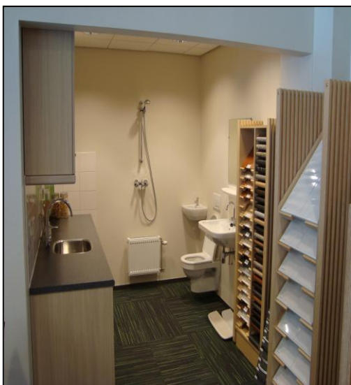
Keuzemogelijkheden in de woonwinkel

Wij zullen, na de acceptatie van de woningen, een keuzeavond organiseren. Wij zullen u, samen met de uitnodiging voor deze keuzeavond, een keuzeformulier toesturen waarop alle keuzemogelijkheden zijn genoemd. De keuzeavond zal naar verwachting in september 2011 plaats vinden.