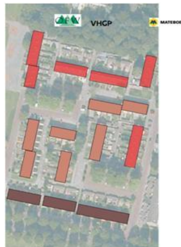
Afbeelding 2. Kleurverdeling metselwerk