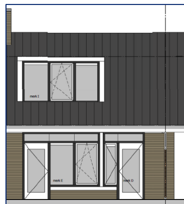
Afbeelding 1. Nieuwe kozijnindeling seniorenwoningen

Bij de eengezinswoningen is een dubbele bovendorpel gemaakt waaraan eventueel een zonnescherm bevestigd kan worden. Deze dubbele bovendorpel zou ook gemaakt worden bij de seniorenwoningen. Het is gebleken dat er bij de seniorenwoningen in de nieuwe situatie onvoldoende ruimte is om een zonnescherm te bevestigen. Het gevolg is dat bij de meeste bewoners van de seniorenwoningen de zonwering daarom niet teruggehangen kan worden. Daarom is, in overleg met de bewonerscommissie, de kozijnindeling aan de achterzijde van de woning aangepast conform afbeelding 1.