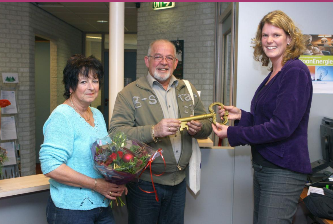
Overhandiging 1 e sleutel van een opgeleverd project.