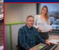
HUURDERSADMINISTRATIE STRENG & SOCIAAL