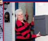
BETER PETER BESPAART