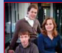
LEERBEDRIJF VAN HET JAAR