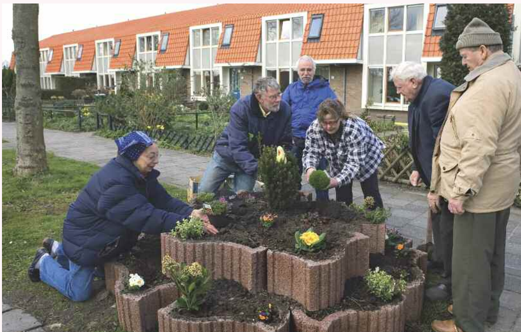
De 'tuinploeg' van de Fruithof is enthousiast begonnen met het beplanten van de vijf bloembakken.

Zo'n tien enthousiaste bewoners van De Fruithof in Biddinghuizen gaan ervoor zorgen dat vijf grote bloembakken steeds gevuld zijn met kleurige beplanting. Het is een voorbeeld van hoe bewoners samen de verantwoordelijkheid voor hun straat op zich kunnen nemen. "En als het eenmaal loopt, komen er zeker nog meer burens helpen!" Op 19 april worden de bloembakken feestelijk 'geopend'.