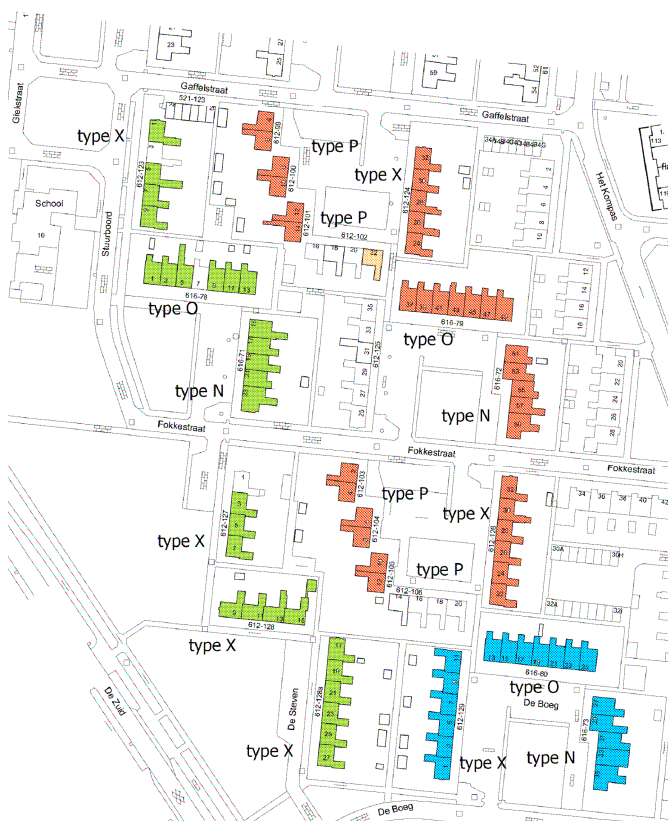
Woningtypen en varianten Fase 1

De kozijnen van de berging worden vervangen, inclusief het glaswerk. Ook hier wordt HR++ glas toegepast.