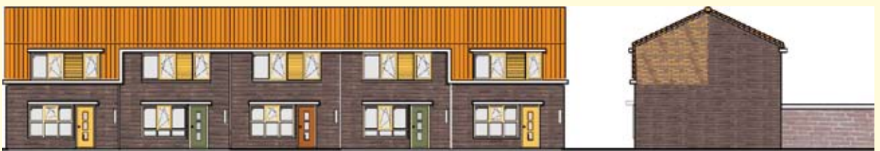
De nieuwe ontwerpen van de modernisering in de Schelpenbuurt/ Bazaltstraat

In juni start bouwbedrijf Salverda met de werkzaamheden. De eerste werkzaamheden bestaan uit het vervangen van het voegwerk van de bergingen. De houten bergingen in de Schelpenbuurt worden dan vervangen. Na de bouwvak wordt gestart met de woningmodernisering. De afronding van het hele project is naar verwachting in juli 2010.