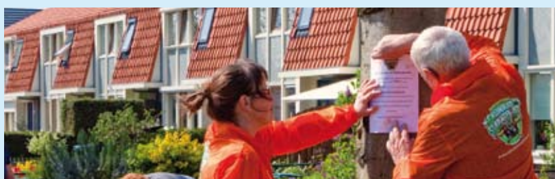
Bewoners Biddinghuizen zetten zich in voor een beter klimaat.

Energiebesparing is zowel goed voor de portemonnee van huurders als voor het milieu. Daarom plaatste de Woonbond in oktober 2008 zijn handtekening onder het Convenant Energiebesparing Corporatiesector. Samen met de vereniging van woningcorporaties