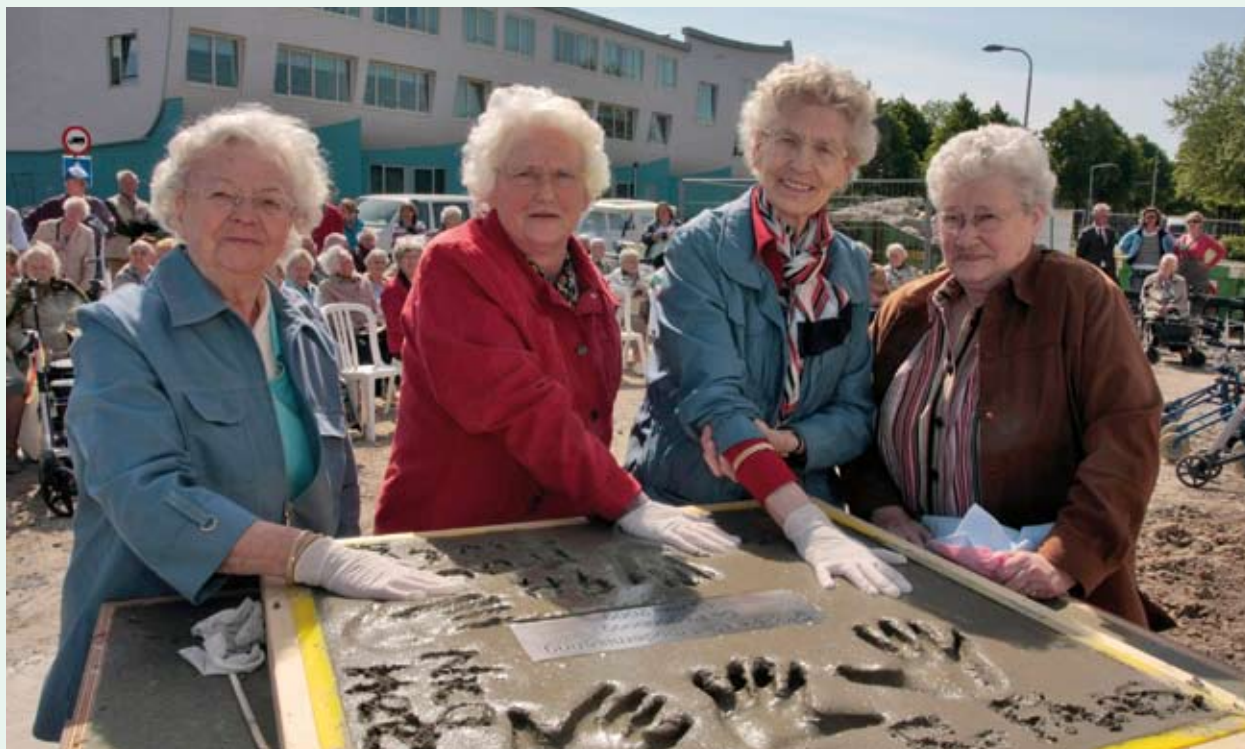
De dames van Dalen, Morier, en Westdijk lieten zich dit niet nog een keer zeggen en plaatsten enthousiast hun hand in het cement.

wordt een aantal gereserveerd voor mensen die in de laatste maanden van hun leven zorg nodig hebben.