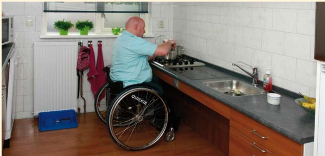
Een woning kan worden aangepast aan de beperking van de bewoner.

Door goede samenwerking tussen gemeente Dronten en OFW is de doorlooptijd van het WMO-proces aanzienlijk verkort. Doordat beide partijen de werkwijze nauwkeurig op elkaar afstemmen, kunnen zij de klant nog beter van dienst zijn. Dit betekent dat een woning sneller kan worden aangepast, als dit nodig is door de beperkingen van de bewoner.