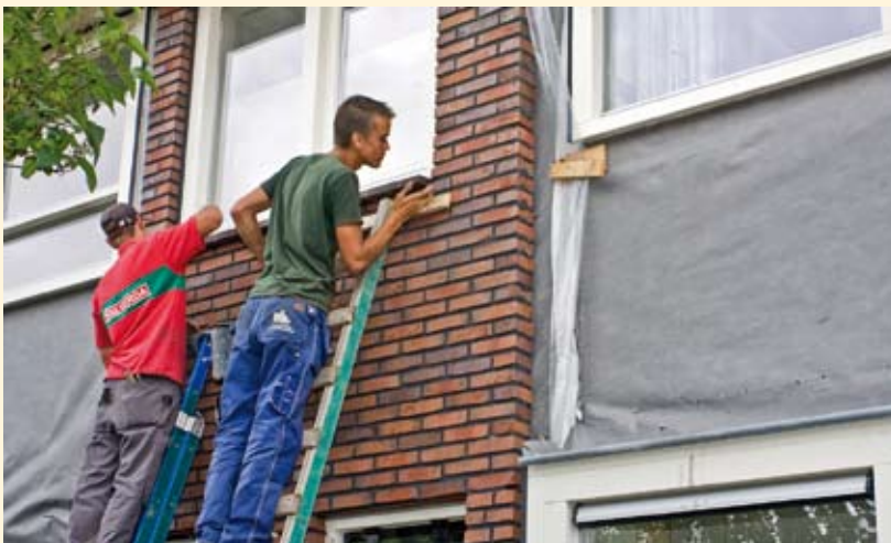
Onder begeleiding van ervaren leermeesters krijgen de leerlingen de kans het vak van metselaar of timmerman in de praktijk te leren

In Biddinghuizen moderniseert Oost Flevoland Woondiensten niet alleen 80 huurwoningen aan de Klaversingel en de Uitloper, het bouwterrein is ook een erkende leerlingbouwplaats. Hierdoor krijgen leerlingen de kans het vak van metselaar of timmerman in de praktijk te leren. Opdrachtgever OFW werkt hier graag aan mee, want goed opgeleide vakmensen blijven nodig.