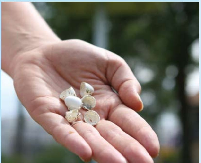
De uitgekomen eieren van de eerste jonge zwaluwen uit de zwaluwtil.