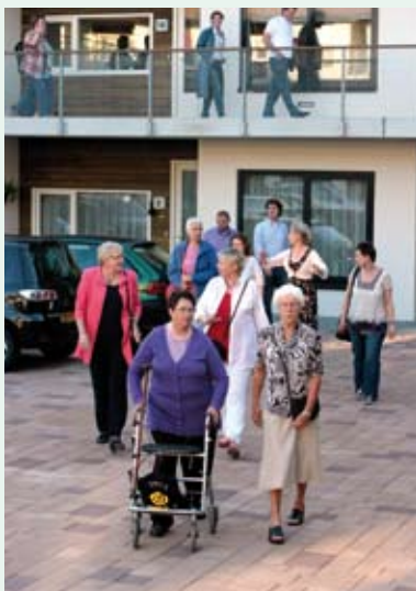
Twee bewoners van De Tas lieten hun woning aan de aanwezigen zien.

De Fruithof heeft maar weinig woningen. Des te groter is de prestatie dat zij zoveel punten wisten te halen. Met hun prijs organiseerden ze een buurtbarbecue. Die barbecue viel zo in de smaak dat de barbecue nu elk jaar een vervolg krijgt.