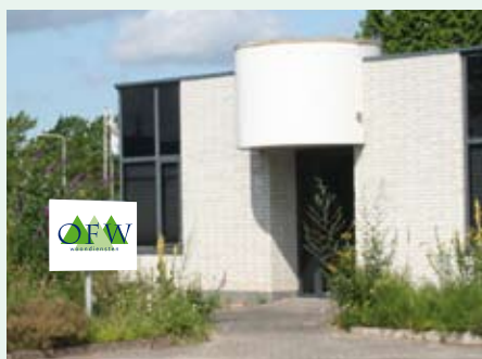
Het tijdelijke pand aan de Fazantendreef

Het huidige pand van OFW is te klein geworden. Daarnaast is het aanzienlijk verouderd. Daarom gaat OFW haar kantoor moderniseren. Met de modernisering wordt het pand uitgebreid en aangepast aan de eisen van deze tijd. We kunnen dan in de toekomst onze klanten op een goede manier ontvangen en kunnen een prettige werkomgeving bieden aan onze medewerkers.