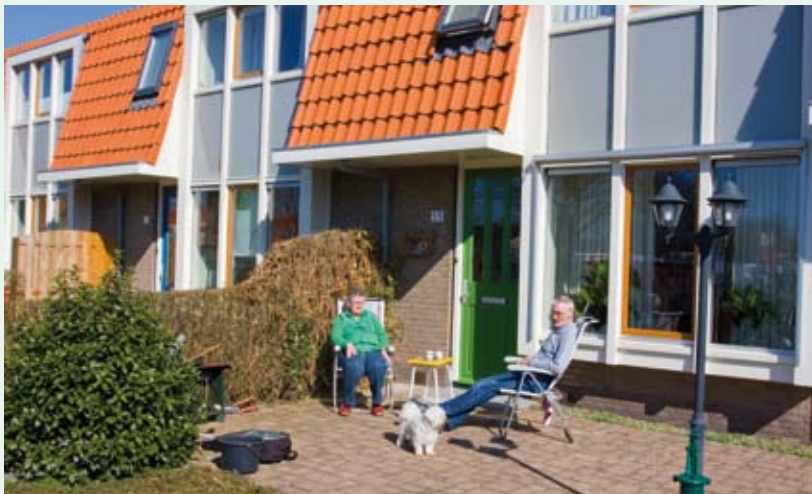
In de wijk Biddinghuizen Centrum is de herstructurering bijna afgerond.

Wijk De Boeg scoort op veel aspecten hoger dan in 2006. In 2006 bleek al dat de bewoners van de wijk De Boeg positief waren over de ontwikkeling van hun buurt. In vergelijking met 2006 vinden bewoners dat deze buurt vooruitgaat. Dat komt waarschijnlijk door de gerealiseerde herstructurering van de wijk en de afronding van appartementencomplex Tij. Als het appartementencomplex Bries klaar is, dan is de wijk helemaal af. In Biddinghuizen Centrum is een groot aantal woningen gemoderniseerd en gebouwd. De laatste jaren stond het bevorderen van de leefbaarheid in deze wijk hoog op de agenda, zowel bij de gemeente