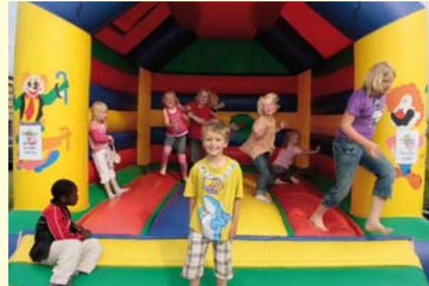
Met een springkussen was er voor de kinderen ook veel speelplezier.

In november 2007 startte de bouw van deze 76 eengezinswoningen. Er zijn verschillende types gebouwd. Tijdens de bouw is extra aandacht besteed aan de duurzaamheid. Alle woningen hebben al energielabel A, maar er zijn nog extra duurzame maatregelen genomen. Zo is er extra isolatie gebruikt en door middel van vraaggestuurde venti-