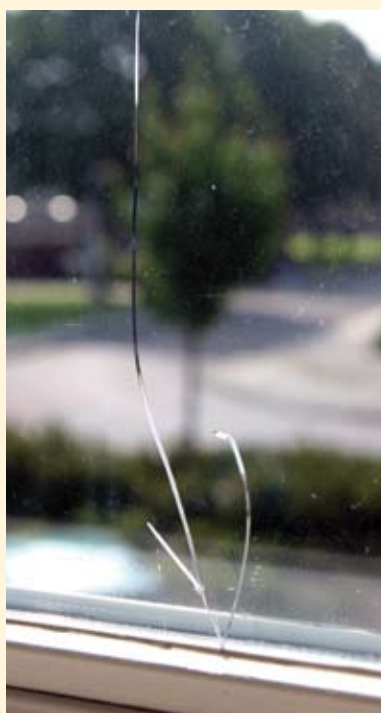
Doordat er een cd-box in de vensterbank stond, weerkaatste het licht van de cd naar het glas. Hierdoor werd het glas warm en ontstond er een thermische breuk.

Een thermische breuk is te herkennen aan een speciaal breukpatroon en is niet te vergelijken met het breken van glas door bijvoorbeeld het inslaan van de beglazing. Een thermische breuk is te herkennen aan één breuklijn die loodrecht vanuit de rand van het glas begint en daarna in grillige vorm verder loopt.