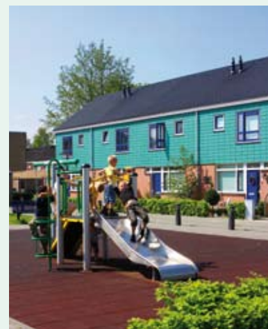
Wijk De Boeg heeft een hele metamorfose ondergaan.

De uitkomsten van het leefbaarheidsonderzoek kunt u zelf bekijken op www.lemoninternet.nl